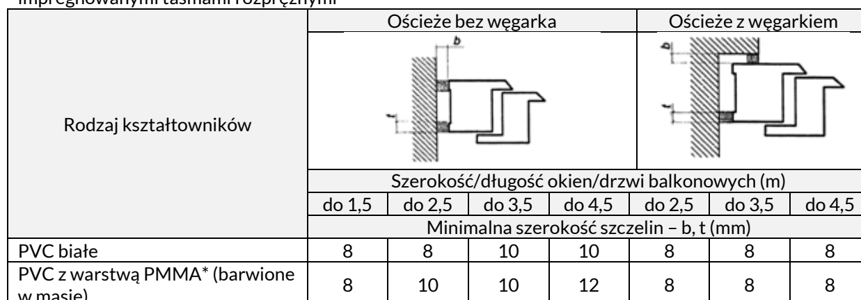
Tablica 4. Minimalna szerokość szczelin między ramą ościeżnicy a ościeżem przy uszczelnieniach impregnowanymi taśmami rozprężnymi*

Przy wykonywaniu uszczelnień z kitów trwale elastycznych należy przestrzegać zasady, że głębokość warstwy uszczelnienia t powinna odpowiadać co najmniej połowie szerokości szczeliny b i wynosić nie mniej niż 6 mm.